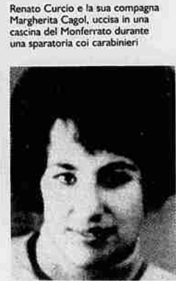
Renato Curcio e la sua compagna Margherita Cagol, uccisa in una cascina del Monferrato durante una sparatoria coi carabinieri

crudo, i «sciccioli» micidiali e un frizzantino da far impallidire anche il ricordo di Lenin. Poi i primi: tortelli di bietola caserecci, lasagne, cannelloni, cappelletti in brodo. Poiché l'appetito viene mangiando, dicevano i vecchi saggi, anche i secondi erano all'altezza: arrosti misti, coniglio, farosna, agnello. Immacabile e riccicatissimo lo zampone. Contorni, patatine e insalata. Infine, il trionfo della cucina, torte di frutta o al mascarpone. Il tutto, rallegrato da una pioggia di lambusco emiliano. Prezzo proletario, circa 4 mila lire.